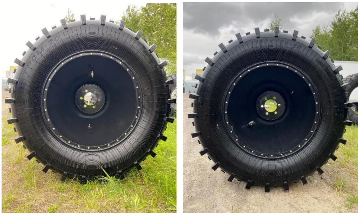
Шина Тром 20 1750x750x38

Видео по шине Мамонт https://rutube.ru/video/e9cb01a28b988a0f42018b5b173c337f/