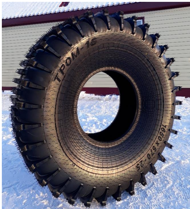
Шина Тром 16 1650x570x25

Стоимость на январь 2025г для 4х колесной техники составляет 100 000,00 рублей включая НДС 20%