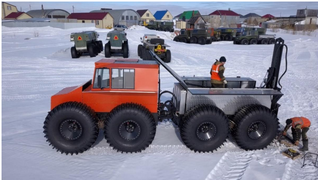
Снегоболотоход Тром 8 оснащенный буровой установкой Т-2, инструмент 1,5м усилие вращателя 400кг/м

Стоимость на июль 2025г 13 500 000,00 рублей включая НДС 20%