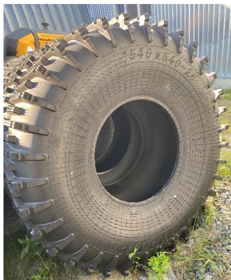
Шина Тром 8 1540x540x25

Видео по шине Тром 22 https://rutube.ru/video/75a72f6b457382653a219d160e7b2422/