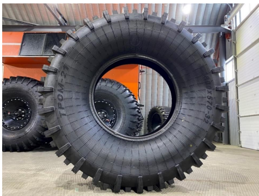
Шина Тром 21 1800x570x32

Видео по шине Тром 20 https://rutube.ru/video/d3fa438eb26fe4cc5fb039b67b16ceb8/