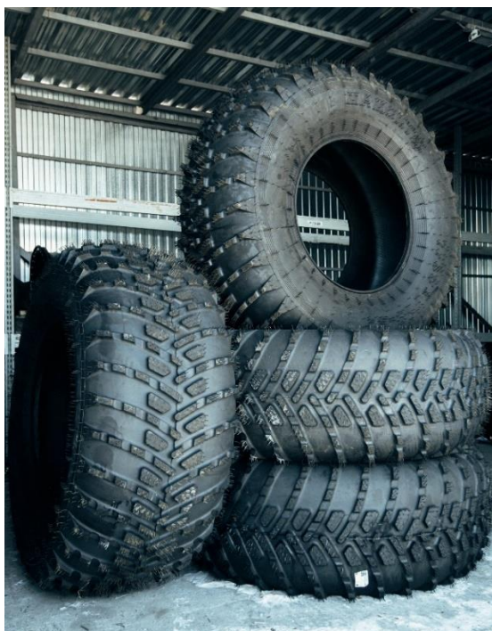
Шина Мамонт 1780x710x32

Видео по шине Тром 16 https://rutube.ru/video/8902840628f6e76e8b9e292c0695ccc7/