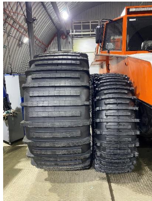
Шина Тром 22 1960x900x38

Продается только как ЗИП на реализованную технику.