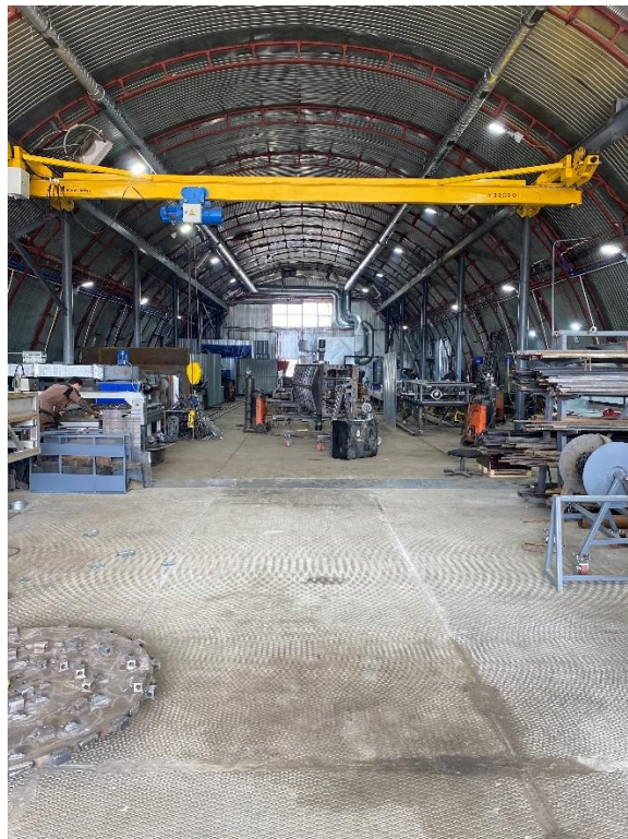
Цех обработки металлов и сварочное производство.

Видео цехов https://rutube.ru/video/a1a8cc3e7b14c37842b09aeabca4af44/