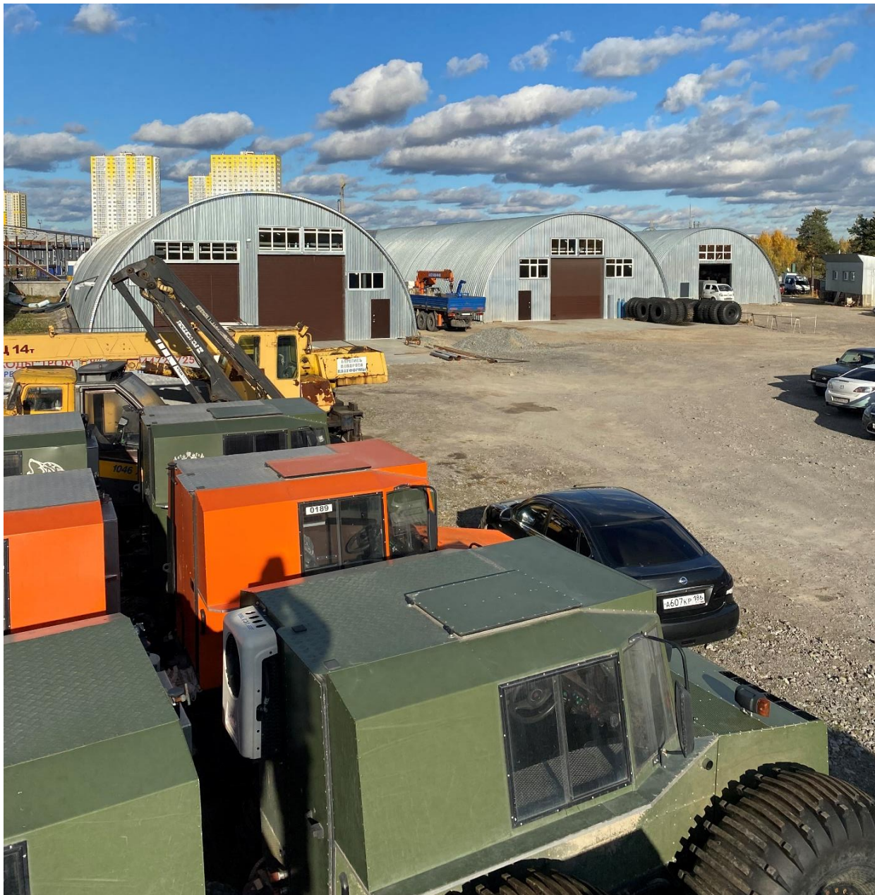
Общий вид производственной площадки