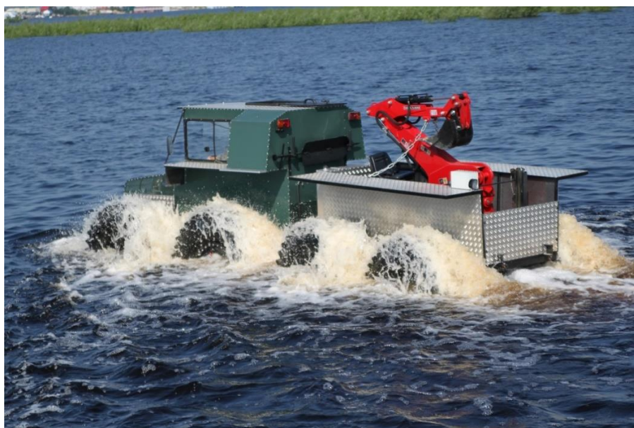
Снегоболотоход Тром 8 оснащенный экскаватором УЭ-225 глубина 2,25 м, усилие 1,7тонн.

https://rutube.ru/video/ca95e78a73caa98f180816bb4940a705/