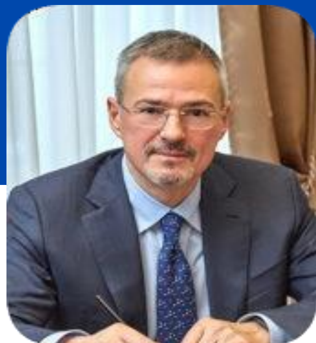
Артём Владимирович Горный

Директор департамента культуры Министерства обороны РФ