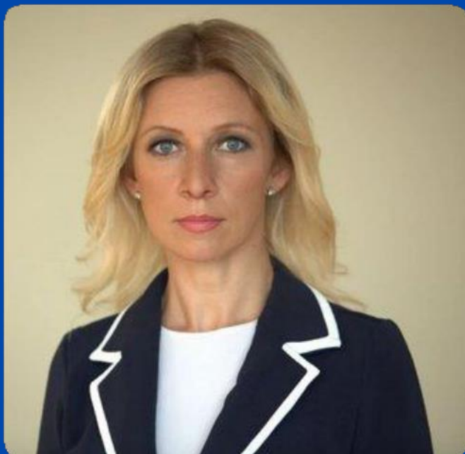
Мария Владимировна Захарова