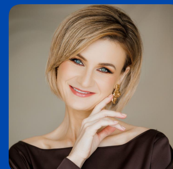
Мария Валерьевна Бутина