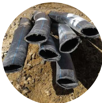
Потеря эксплуатационных характеристик