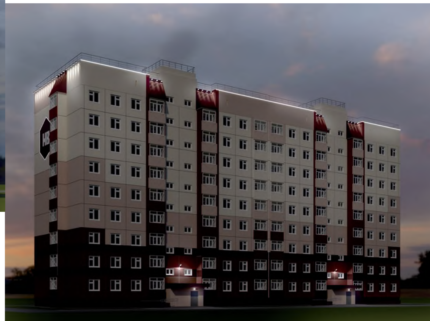
Общий вид на жилой дом № 4/1 в ночное время с подсветкой