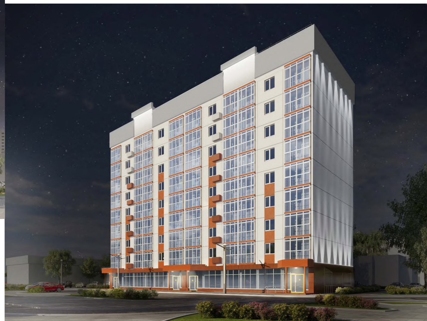
Общий вид на жилой дом № 4/2 в ночное время с подсветкой