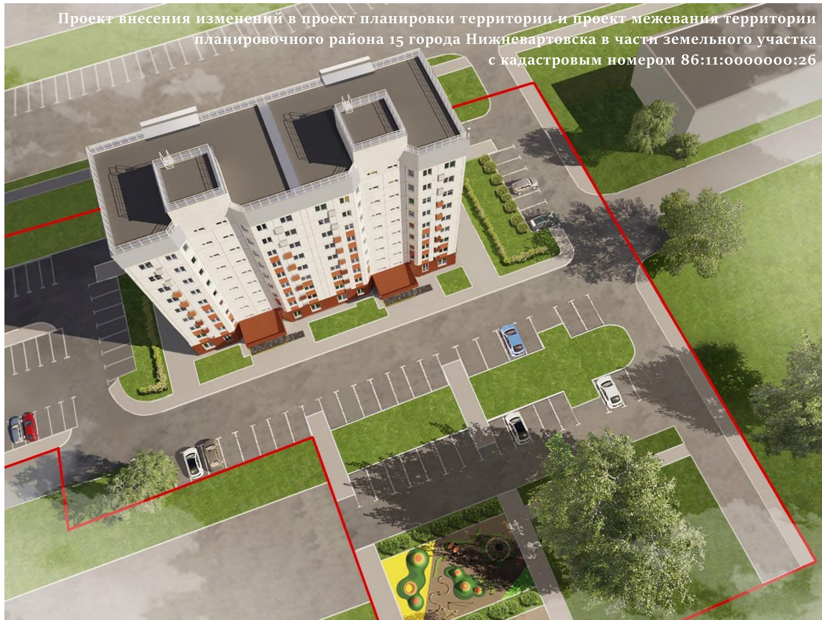
Вид сверху на жилой дом № 4/2

Проект внесения изменений в проект планировки территории и проект межевания территории планировочного района 15 города Нижневартовска в части земельного участка с кадастровым номером 86:11:0000000:26