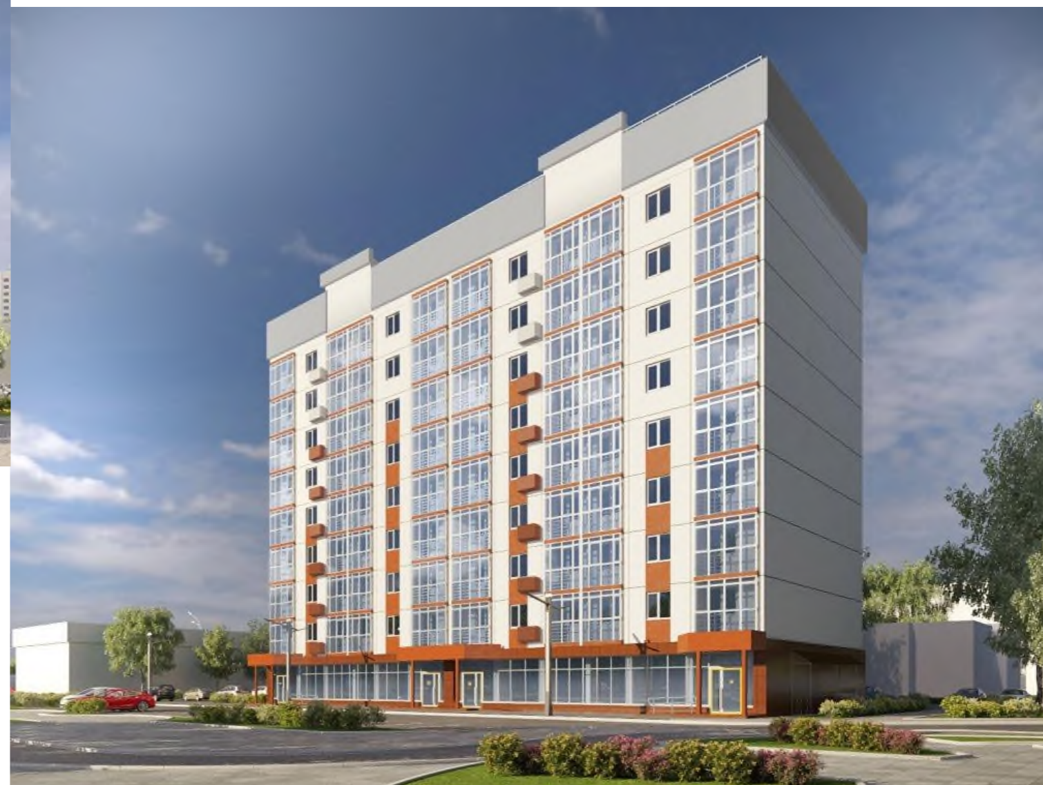
Общий вид на жилой дом № 4/2