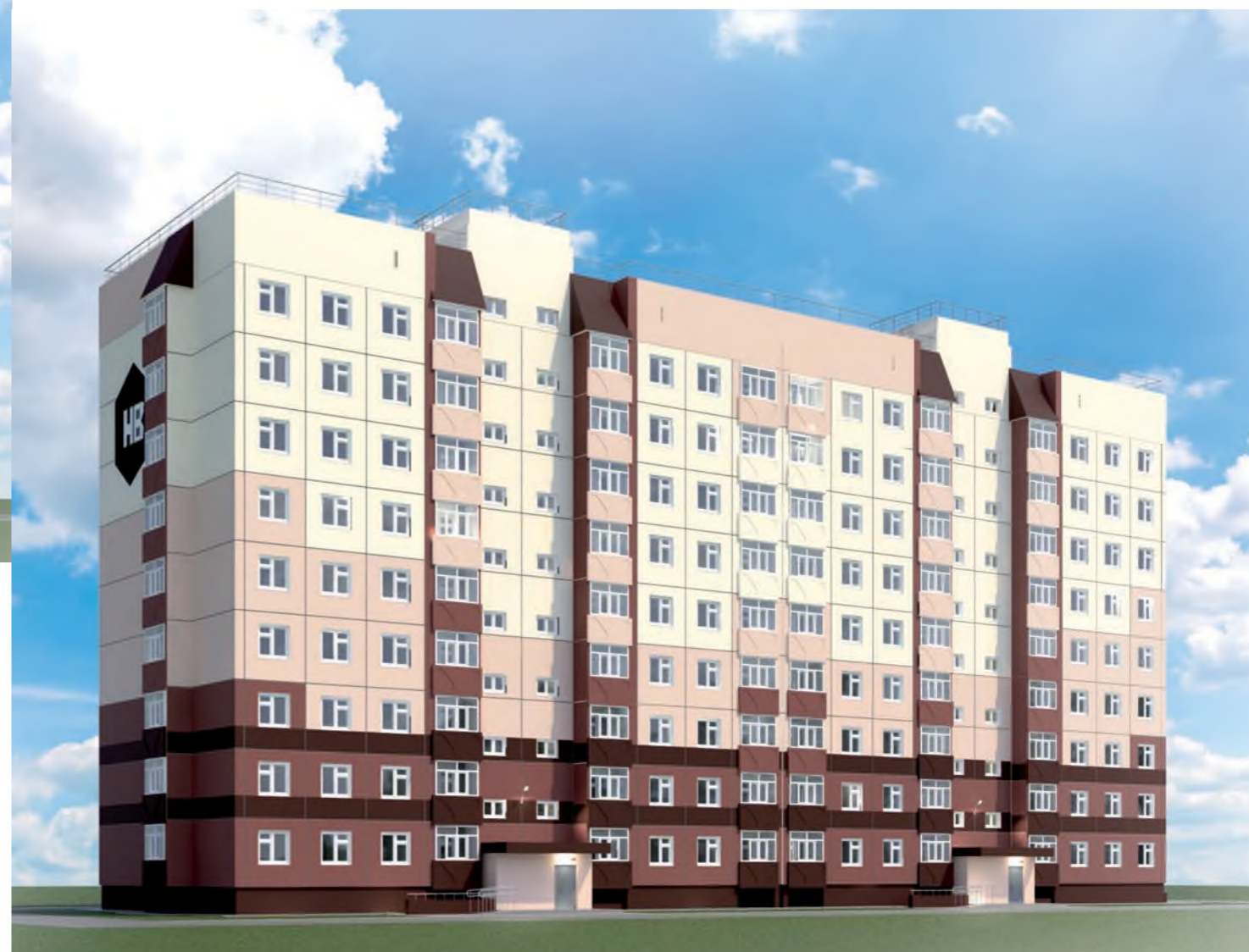
Общий вид на жилой дом № 4/1